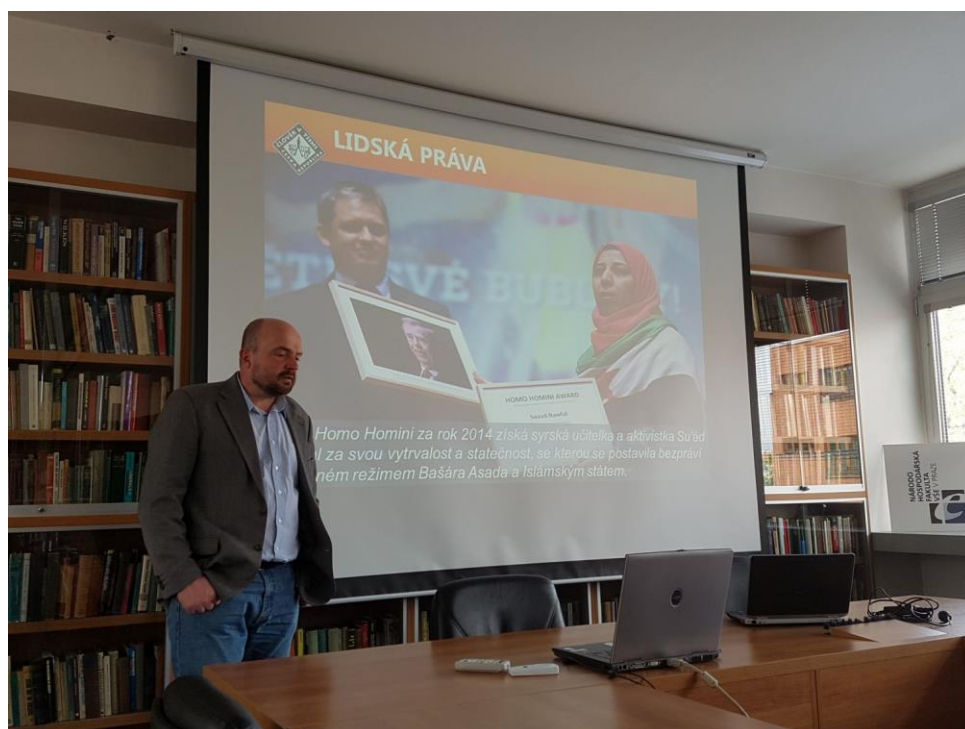
Člověk v tísni každoročně na zahájení festivalu dokumentárních filmů o lidských právech Jeden svět uděluje cenu Homo Homini osobnostem, které se významně zasloužily o prosazování lidských práv, demokracie a nenásilného řešení politických konfliktů.